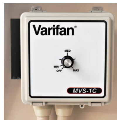
スピードコントローラー