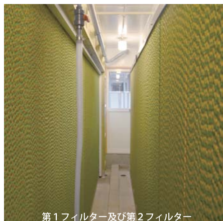
第1フィルター及び第2フィルター