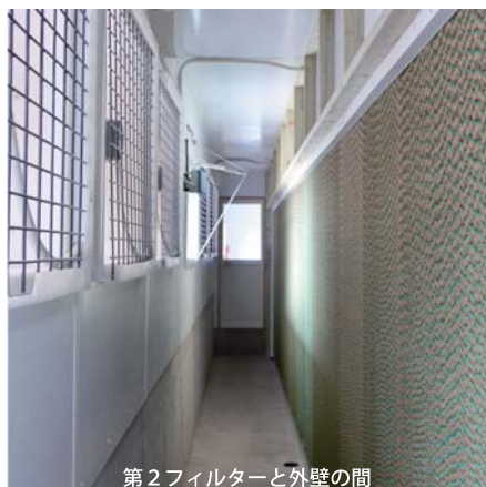
第2フィルターと外壁の間