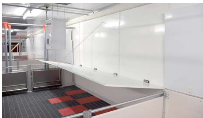
パネル豚舎内部（離乳豚舎）