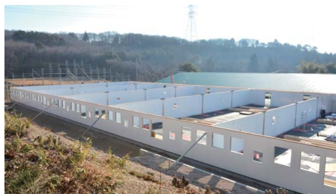
パネル豚舎施工風景