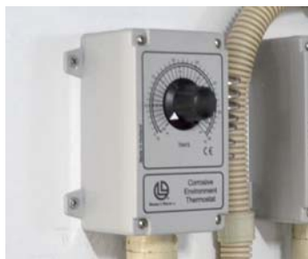
サーモスタット (循環ポンプの制御用)